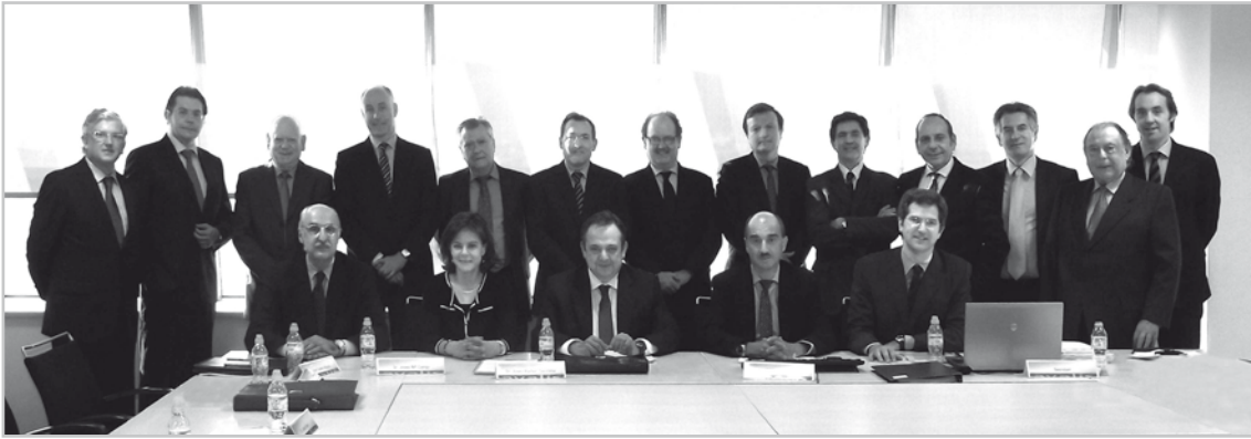
Consell d'Administració Consejo de Administración